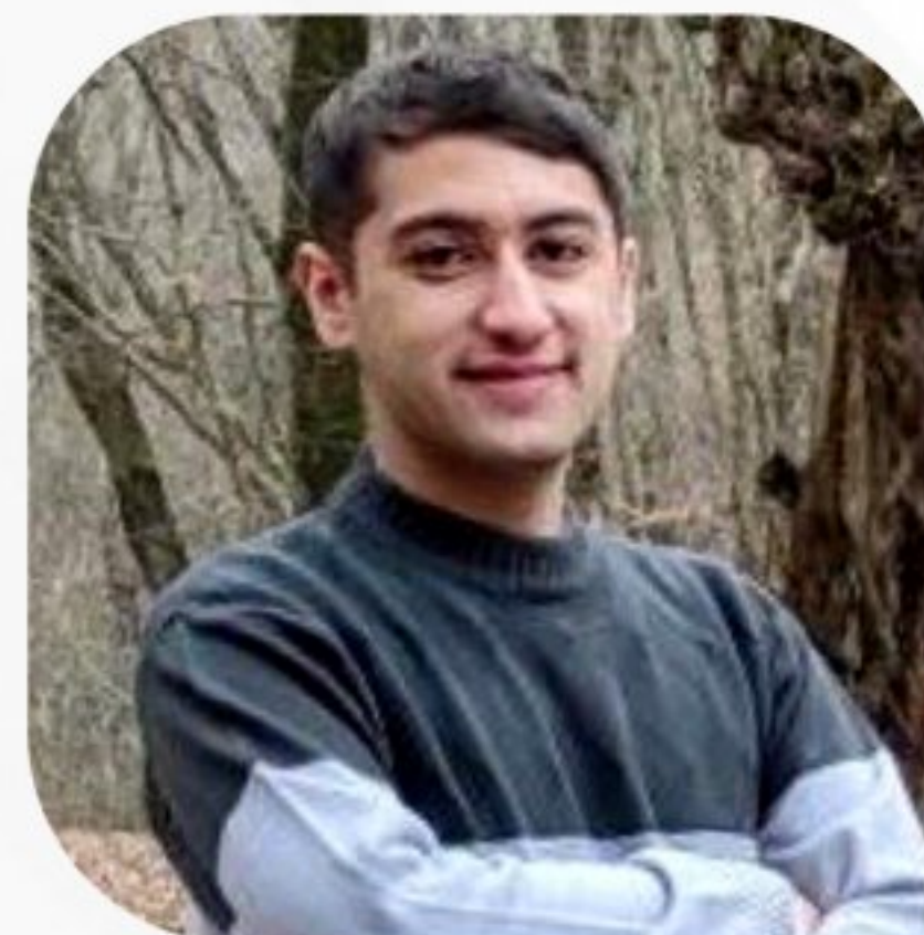
محمد رضا شمشاد